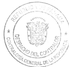
GERARDO SOLÍS CONTRALOR GENERAL