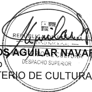
CARLOS AGUILAR NAVARRO Ministro MINISTERIO DE CULTURA